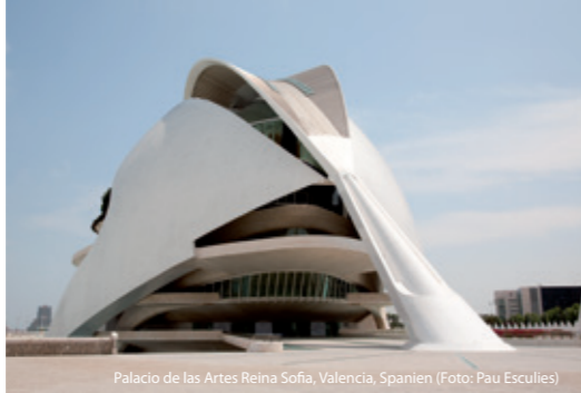
Palacio de las Artes Reina Sofia, Valencia, Spanien