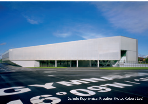
Schule Koprivnica, Kroatien