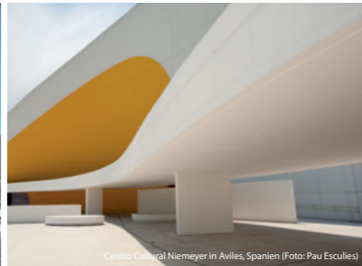
Centro Cultural Niemeyer in Aviles, Spanien