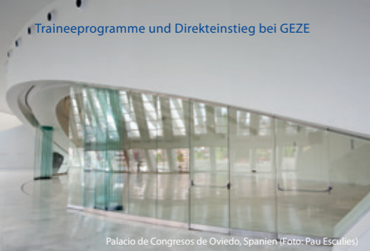
Palacio de Congresos de Oviedo, Spanien