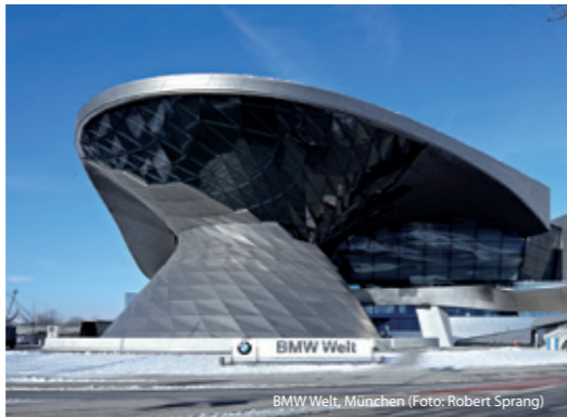
BMW Welt, München