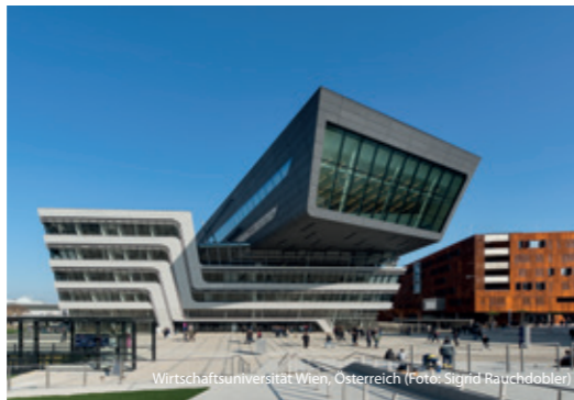
Wirtschaftsuniversität Wien, Österreich