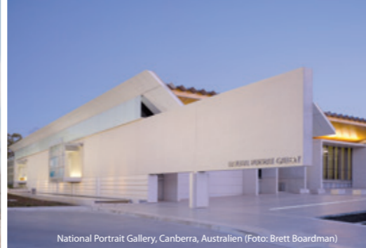
National Portrait Gallery, Canberra, Australien