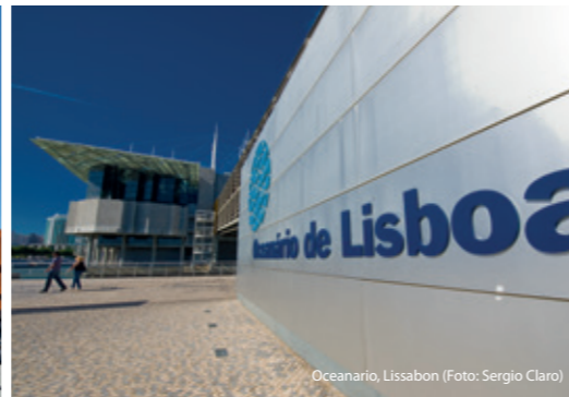
Oceanario, Lissabon